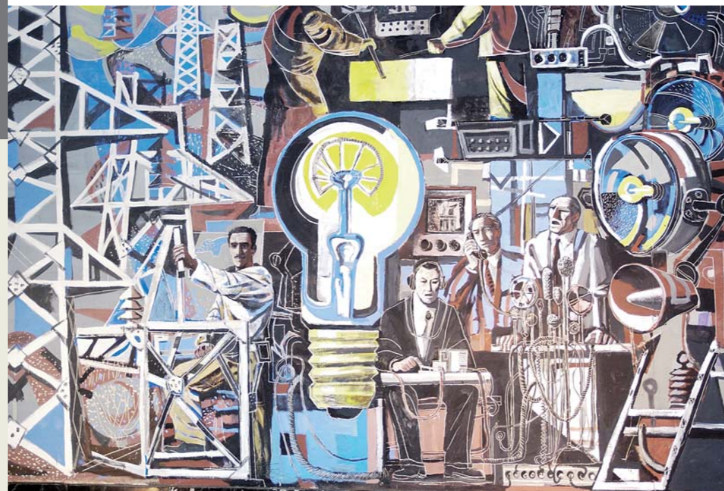
Pintura mural realizada por Joaquín Vaquero Palacios y su hijo Joaquín Vaquero Turcios. Central Hidroeléctrica de Grandas de Salime. © INCUNA