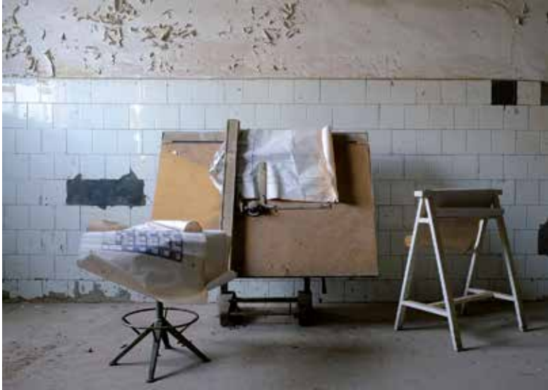
PRIMER PREMIO 2017: Rafael Paz Díaz-Romeral (Getxo, Vizcaya) Estudio de delineación en la fábrica Valca