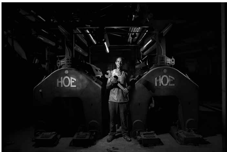
Primer Premio 2020: "El abuelo de la imprenta" , de Franck Depaifve (Bruselas, Bélgica)